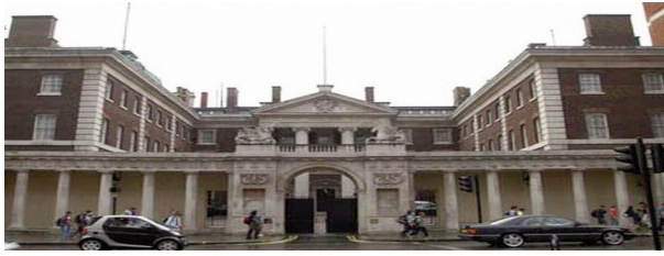
Groupe de Projet : Le Facteur Humain en Administration Publique, Page 2