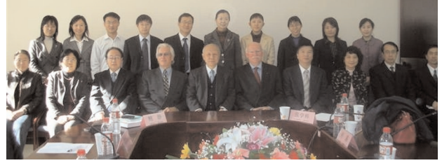
Chine - Indonésie, Page 3