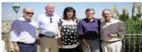
GEAP - Conférence annuelle, Madrid, Espagne, 19-22 septembre 2007, Page 4