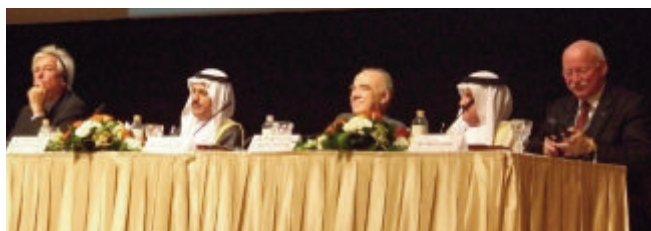
IISA-AIEIA - 27ème Congrès, Abu Dhabi, EAU, 9-14 juillet 2007, Page 2