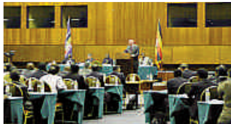
Conférence de Kampala-AIEIA, Page 2