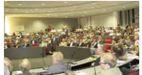
Conférence de Rotterdam-GEAP, Page 2