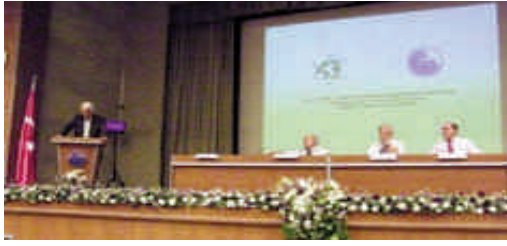
Conférence d'Ankara-IISA, Page 2